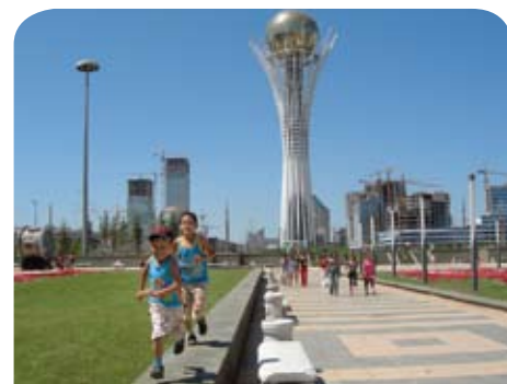
Torre Bayterek, de 100 metros de altura, en Astana, Kazajstán: El país logró ascender del nivel del SGDD al de las NEDD en 2003.

En el libro se incluyen además estudios empíricos sobre los efectos de la Iniciativa en la eficiencia del mercado y se demuestra que la participación, especialmente de los países suscritos a las NEDD, ayuda a redu-