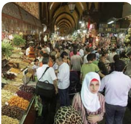
De compras en el Gran Bazar de Estambul. La inflación en Turquía está empezando a aumentar.

En este contexto, la restricción crediticia mundial afecta particularmente a Turquía en vista de sus considerables necesidades de financiamiento externo: cerca del 17½% del PIB en 2008. A juzgar por las tendencias históricas, la estrechez del crédito mundial normalmente supondría una reducción de las entradas de capital a este país, aunque