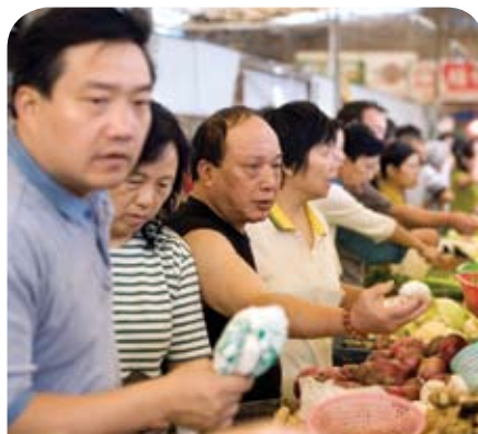
Compra de hortalizas en un supermercado de Pekín, China. Los precios de los alimentos están aumentando en todo el mundo.

Plant: Sí, con mucha rapidez. El FMI prepara una revisión del Servicio para Shocks Exógenos (SSE) a ser considerada por el Directorio en junio. El servicio actualizado brindará financiación más rápida y eficaz, y será una versión simplificada de los instrumentos para países de bajo ingreso. Pero cabe destacar que el SSE está disponible ahora para cualquier país que precise ayuda inmediata.