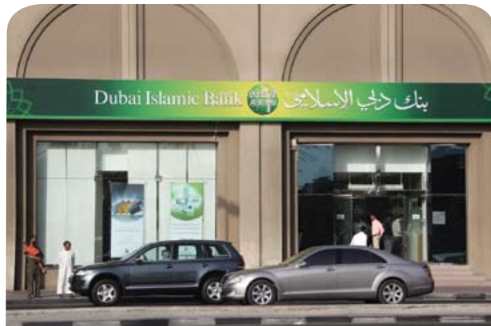
La banca islámica se concentra en Oriente Medio y Asia sudoriental y en sectores de Europa y Estados Unidos.

La bibliografía que describe las finanzas islámicas es profusa, pero hay relativamente poca labor empírica sobre la banca islámica y la estabilidad financiera, un tema cuyo interés crece a la par del desarrollo de dicha banca. En un reciente documento de trabajo del FMI se intenta cubrir esta carencia con datos sobre 18 sistemas bancarios con una sustancial presencia de bancos islámicos para brindar un análisis empírico internacional del papel de estos bancos en la estabilidad financiera.