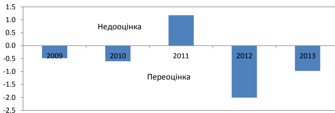
Рисунок 1. Відхилення прогнозного сальдо (% ВВП, факт/прогноз)

20. Мають місце значні проблеми із застосуванням нинішнього підходу до розробки ССБП. Зокрема, цей підхід призводить до фрагментації бюджетного процесу, підриває переконливість не лише річного бюджету й середньострокових бюджетних прогнозів, але й ієрархічного процесу, відповідно до якого прогнози визначають рамки, в яких потім ухвалюються рішення щодо бюджету. Крім того, він розширює можливості політичного впливу на процес прогнозування макропоказників. Таке становище поруч із іншими чинниками пояснює причини виникнення суттєвих похибок в прогнозуванні макроекономічних та бюджетних показників на 2012-2013 роки, які, як видно з рисунка 1, вилилися в суттєву розбіжність між плановими та фактичними показниками бюджету.