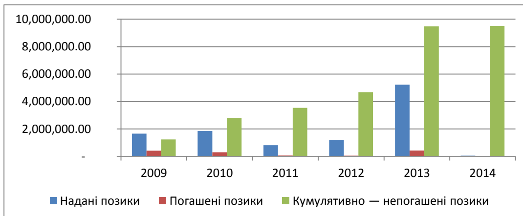
Рисунок 2. Середньострокові непогашені позики місцевим органам влади, з 2009 року по червень 2014 року (тис. грн.)

49. Суттєве значення має той факт, що у 2014 році темпи надання та погашення таких позик істотно зменшилися після стрімкого зростання у 2013 році. Причиною цього, ймовірно, є брак ресурсів для надання таких позик у ДКСУ з огляду на складну ситуацію з ліквідністю та неспроможність місцевих органів влади погашати позики, але це не означає, що проблему недофінансування було розв'язано. Ця ситуація може призвести до стрімкого накопичення простроченої заборгованості, якщо місцеві органи влади не матимуть доступу до фінансування й не буде здійснено терміновий перегляд розміру субсидій, що надаються місцевим органам влади, для приведення їх у відповідність до очікуваного рівня надання послуг у тих сферах, які делеговано місцевій владі.