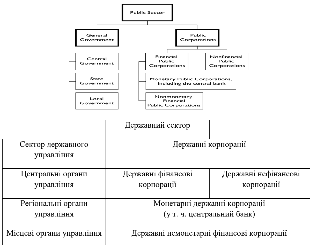
Рисунок 4. Класифікація державного сектору за СДФ (GFS)

120. Формування звітності по державних підприємствах не вимагатиме від них використання казначейської системи чи надання ДКСУ доступу до даних про всі їхні операції. Одним із методів збирання даних для звітності щодо державних підприємств є встановлення вимоги про періодичне надання державними підприємствами агрегованих бухгалтерських даних ДКСУ згідно зі спільним планом рахунків. План рахунків для звітності ДП на початку повинен мати низький рівень деталізації, що забезпечить підтримку звітності по ключових агрегованих показниках, еквівалентних основним категоріям звіту про результати діяльності, звіту про рух грошових коштів та баланс уряду. Консолідація в ДКСУ звітності щодо всього державного сектору вимагатиме надання державними підприємствами ДКСУ достовірних даних про операції ДП, контрагентом за якими є бюджетна установа. Слід очікувати, що, принаймні на початку, деякі ДП виявляться нездатними надавати такі дані через слабкість своїх систем, невідповідність облікової політики або